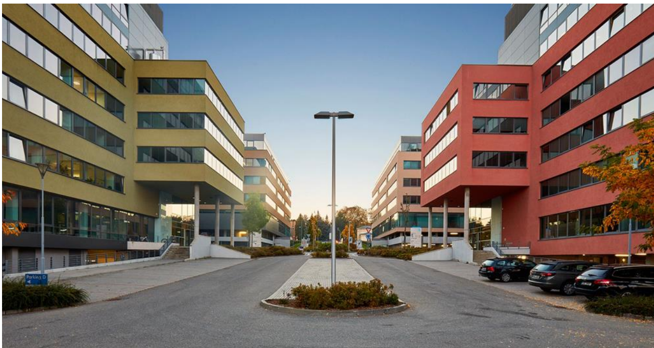
Brno Business Park

S ohledem na účel existence investičního fondu, kterým je vlastní investiční činnost, s ohledem na povinnost akciové společnosti s proměnným základním kapitálem, která nevytváří podfondy, účetně a majetkově oddělovat majetek a dluhy ze své investiční činnosti od svého ostatního jmění a skutečnost, že dluhy vztahující se pouze k jedné části lze plnit pouze z majetku v této části, Fondu vznikají jen náklady spojené přímo či nepřímo s investiční činností, které se hradí z investiční části Fondu. V souladu se statutem Fondu jsou proto poplatky a náklady Fondu hrazeny z investiční části Fondu.