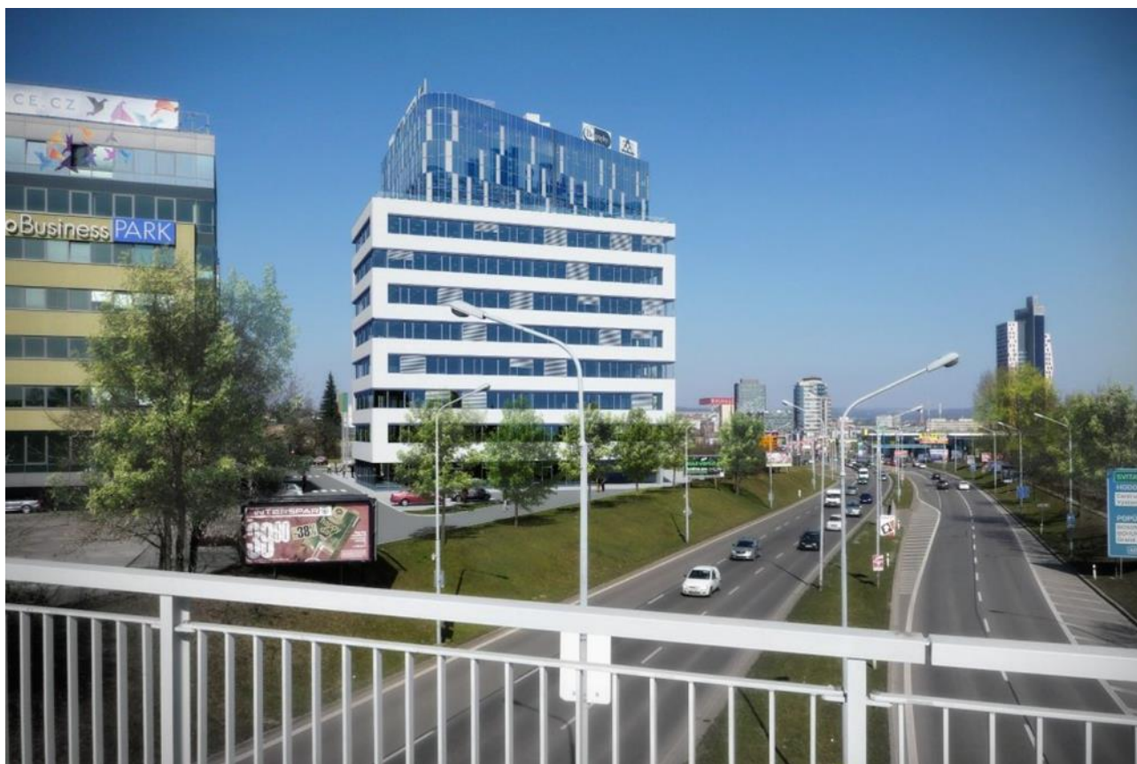
Budova E – BBP OFFICES

Z hlediska významnějších investičních událostí bude fond usilovat o pokračování již započatých projektů. Fond bude nadále pokračovat v přípravě možných investičních projektů. Ve sledovaném období fond pokračuje v realizaci další investici, která představuje výstavbu parkovacího domu a nové budovy Cerit Science Park III v objektu Centrum Šumavská. Fond hodlá v této investici i nadále pokračovat. Fond se i nadále bude věnovat zhodnocení svých stávajících investic. Nadále se fond bude věnovat vyhledávání a vyhodnocování nových investičních příležitostí, kdy konkrétní strategii přizpůsobí výsledku stávajících jednání o akvizici. Fond i v budoucnosti hodlá realizovat obchody prostřednictvím burzy cenných papírů Praha, a.s.