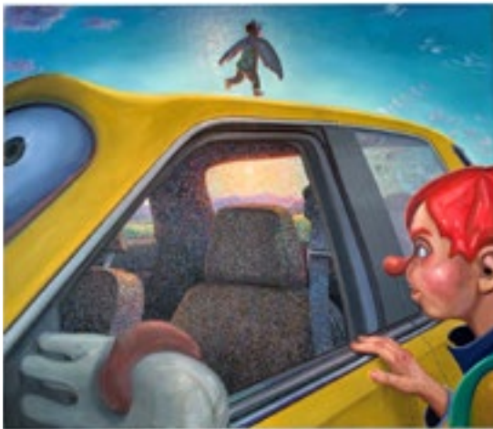
Marek Meduna, Mikrospánek, olej na plátně, 2020, 110x130cm

V dalším období se s našim odborným týmem budeme dále soustředit na výběr uměleckých děl autorů, kteří doplní naše portfolio a vytvoří dobrý základ pro budoucí výrazné zhodnocení fondu.