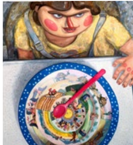
Marek Meduna, Shield of Description, olej na plátně, 2020, 130x120cm

Děkujeme vám za důvěru, kterou nám vyjadřujete investicemi do fondu, a těšíme se na další spolupráci. Pokud budete mít jakékoliv dotazy či připomínky, neváhejte nás kontaktovat.