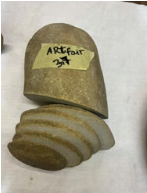
Zhanna Kadyrova, Palianytsia (Stavanger), 2022, 3,7 kg, říční kámen